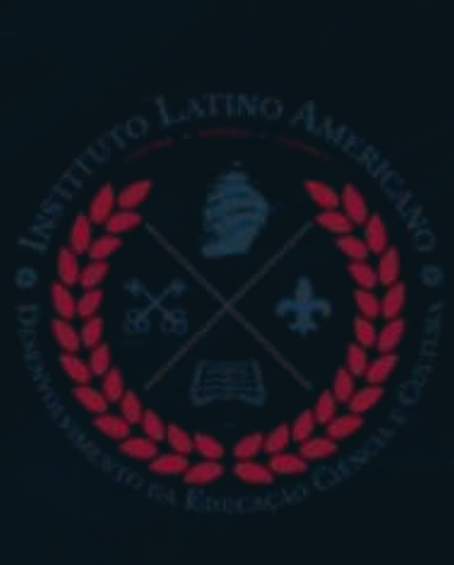
MBA - Negócios Globais