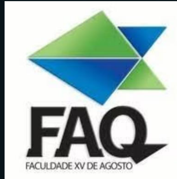
Pós Graduação em Marketing Digital e Negócios Interativos