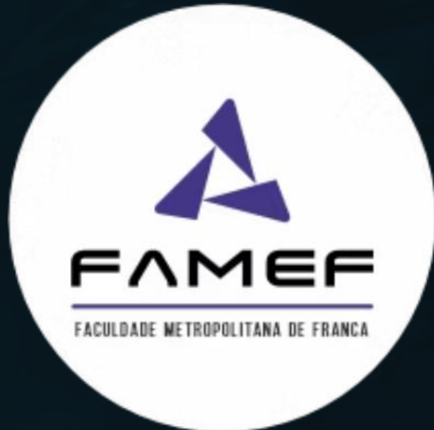
Pós Graduação em Administração Hospitalar