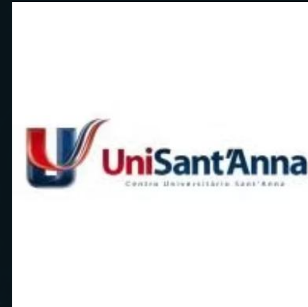
Graduação em Administração de Empresas